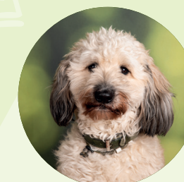
Billie Therapiehond en maatje