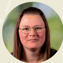
Follie Hagewoud Pedagogisch medewerker